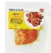
Wegmans Food You Feel Good About Brown Sugar BBQ Seasoned Boneless Pork Shoulder

お肉コーナーの Cook In Package シリーズが便利です。お肉が味付けされた状態でパックされており、売っているそのパッケージごと、指定の温度でオーブン調理します（パッケージはカットしてはいけない、シールは全部剥がすなど、注意事項をよくお読みください）。BBQ 味の豚肩肉は、低温で4時間調理と時間はかかりますが、柔らかお肉が圧力鍋なしでも簡単にできます。しかも、片付けはそのパッケージを捨てるだけです、お手軽です。